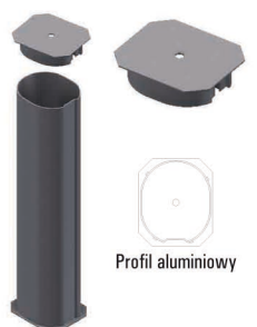
Standardowa tuleja wraz z deklek maskującym