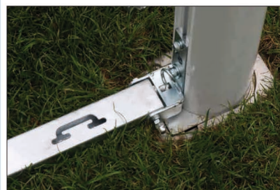
System składania ramy dolnej do słupka ułatwiający pielęgnację murawy