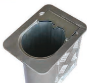
Tuleja przygotowana do założenia bramki